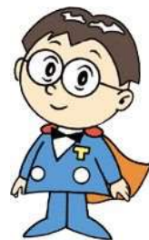
主税局イメージキャラクター タックス・タクちゃん